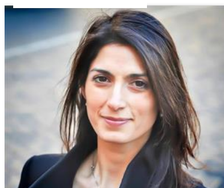
Casal Bruciato, Raggi: i rom restano qui perché ne hanno il diritto