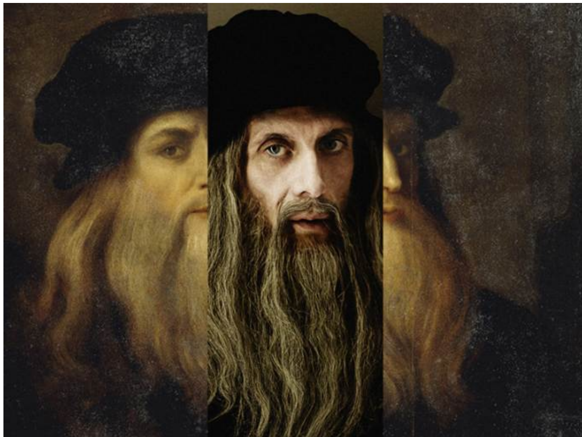
Fino a domenica 5 maggio: "Essere Leonardo da Vinci" in scena al Piccolo Teatro Studio Melato di Milano.

Le mille sfaccettature del grande genio toscano, che ha saputo coniugare pittura, scienza, invenzione e scoperta, si svelano attraverso un'intervista impossibile, condotta da due giornalisti a caccia di scoop.