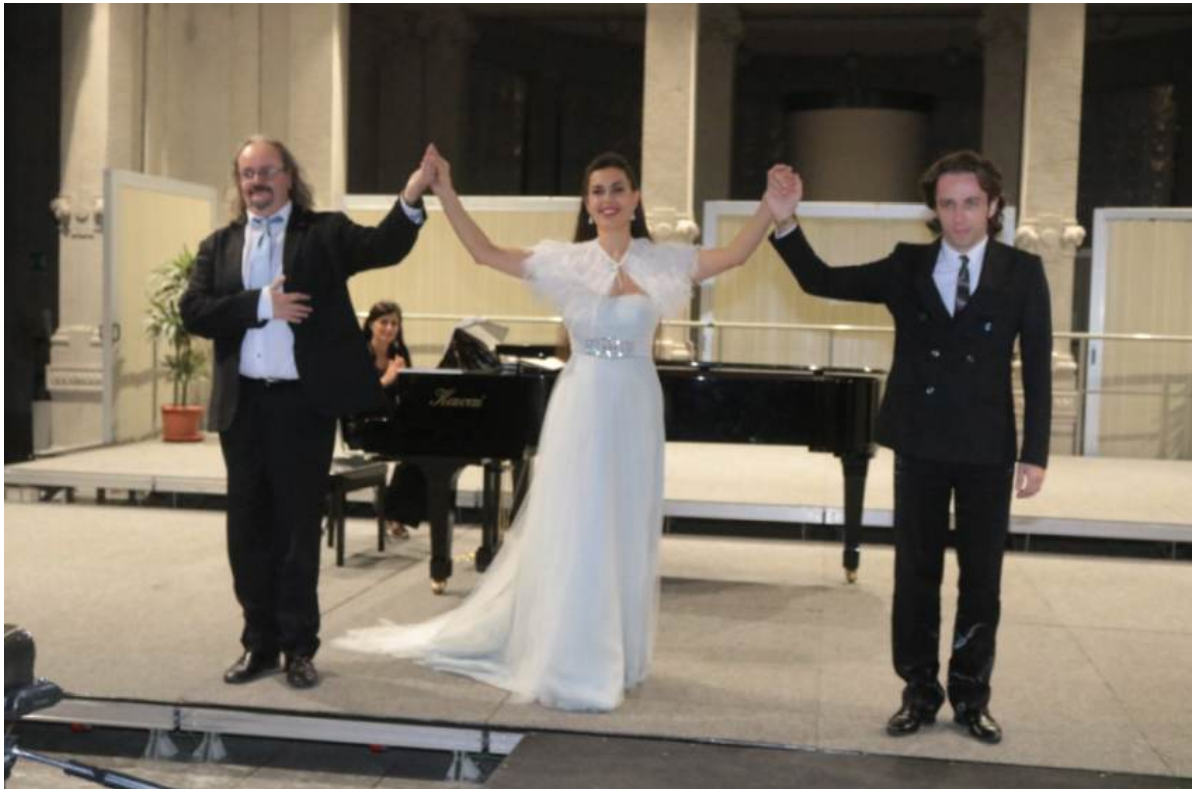
Corvetto in Lirica: concerto gratuito a Milano domenica 5 maggio

L'associazione culturale "Art & Music Insieme" vi invita al Concerto Corvetto in Lirica . Il programma include i pezzi più amati dell'opera lirica , le più famose romanze da salotto e le più celebri canzoni napoletane.