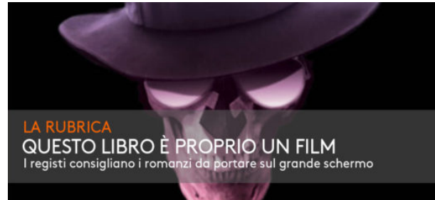
PRIMA PAGINA / QUESTO LIBRO È PROPRIO UN FILM

Frankenstein, King Kong & Co. L'horror da antologia del dr. Carelli