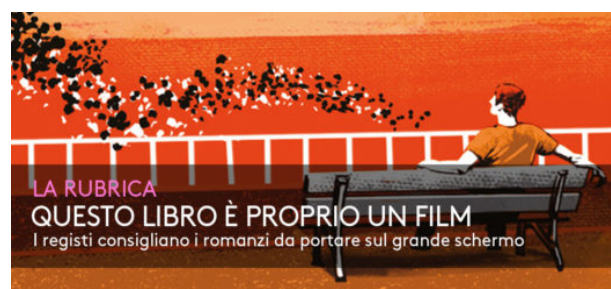
PRIMA PAGINA / QUESTO LIBRO È PROPRIO UN FILM