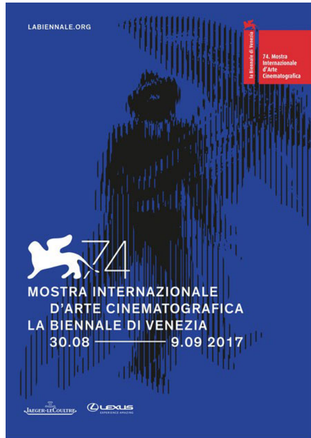
74 FESTIVAL DEL CINEMA DI VENEZIA

Tra gli altri appuntamenti segnaliamo, martedì 20 marzo (ore 18), l'incontro dedicato a "Il futuro è già entrato in noi. Cambiamenti climatica e violenza, nella vita e nella letteratura", con Bruno Arpaia scrittore, autore di Qualcosa là fuori