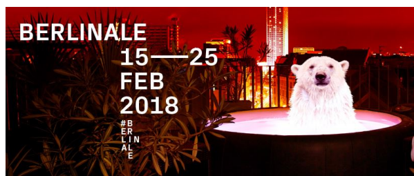
68 FESTIVAL DEL CINEMA DI BERLINO

Il Festival dei Diritti Umani di Milano ha deciso di celebrare il 70° anniversario della Dichiarazione dei Diritti dell'Uomo con un caleidoscopio di brevi film girati da importanti registi e artisti contemporanei. Nel corso della sua terza edizione – che si terrà alla Triennale di Milano dal 20 al 24 marzo – si potranno vedere i 22 "corti" che l'Alto Commissariato dei