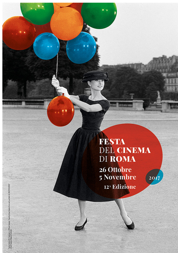
12 FESTA DEL CINEMA DI ROMA

Utilizziamo i cookie per la migliore esperienza sul nostro sito. Continuando la navigazione confermate il vostro consenso all'utilizzo dei cookie.