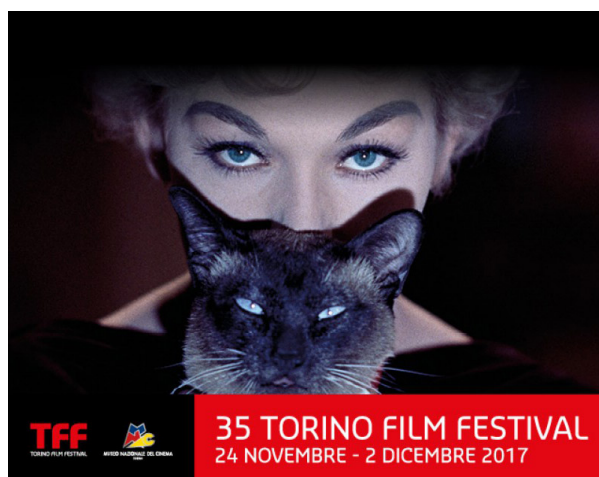
35 TORINO FILM FESTIVAL